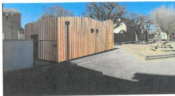
LABRÉ INGENIERIE PC8 Création d'une chaufferie bois sur le commune de BAYET - 03500 Inscription graphique

La laverie sera installée dans la réserve de la salle des fêtes. La commune fera l'acquisition du matériel nécessaire (machines à laver et à sécher, table et fer à repasser). Ce projet fait l'objet de demandes de subvention auprès de la CAF et du Département de l'Allier.