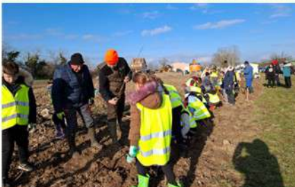
Plantation de la haie vers la gare avec tous les intervenants chasseurs, enfants des écoles, bénévoles et employés communaux

En janvier de cette année nous avons planté environ 300 arbres de petites tailles au rond-point de la carrière et au dépôt municipal vers la gare avec le concours de la Fédération de Chasse 03, la société de chasse de Bayet, quelques bayétois et les enfants de l'école de Bayet.