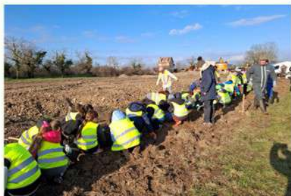
Plantations de la haie au rond-point avec les chasseurs, les bénévoles, les employés communaux